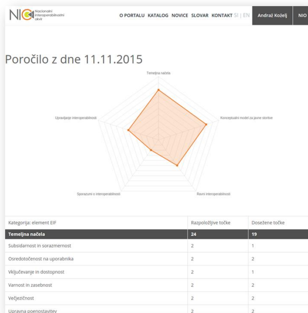
Slika 3: Prikaz integriranega prikaza NIFO.